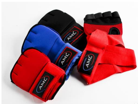
Рис.3. Накладки на вооружённую кисть