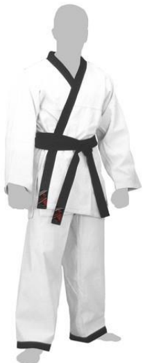
Рис. 1. Униформа спортсмена.

Добок – униформа для хапкидо, включающая в себя куртку и брюки, пояс в цветовой гамме, соответствующей стилевой принадлежности.