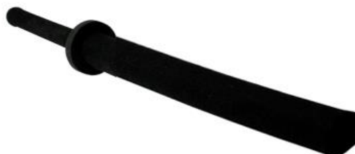
Рис. 4. Спортивный танбон