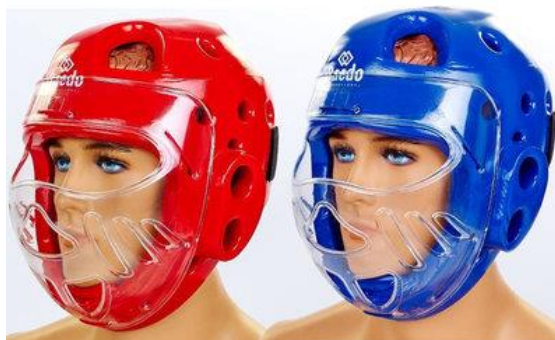
Рис. 2. Шлем с маской